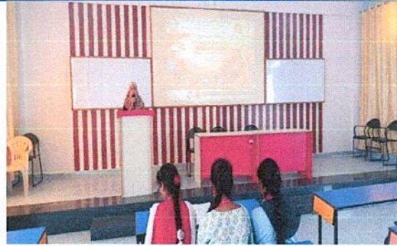
Students participating in Elocution Competition