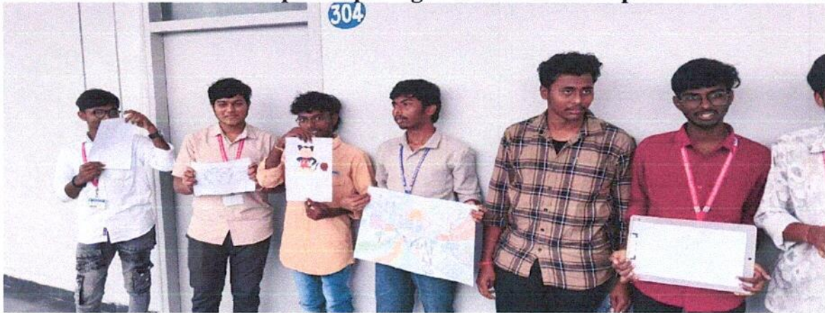
Students participating in Painting Competition