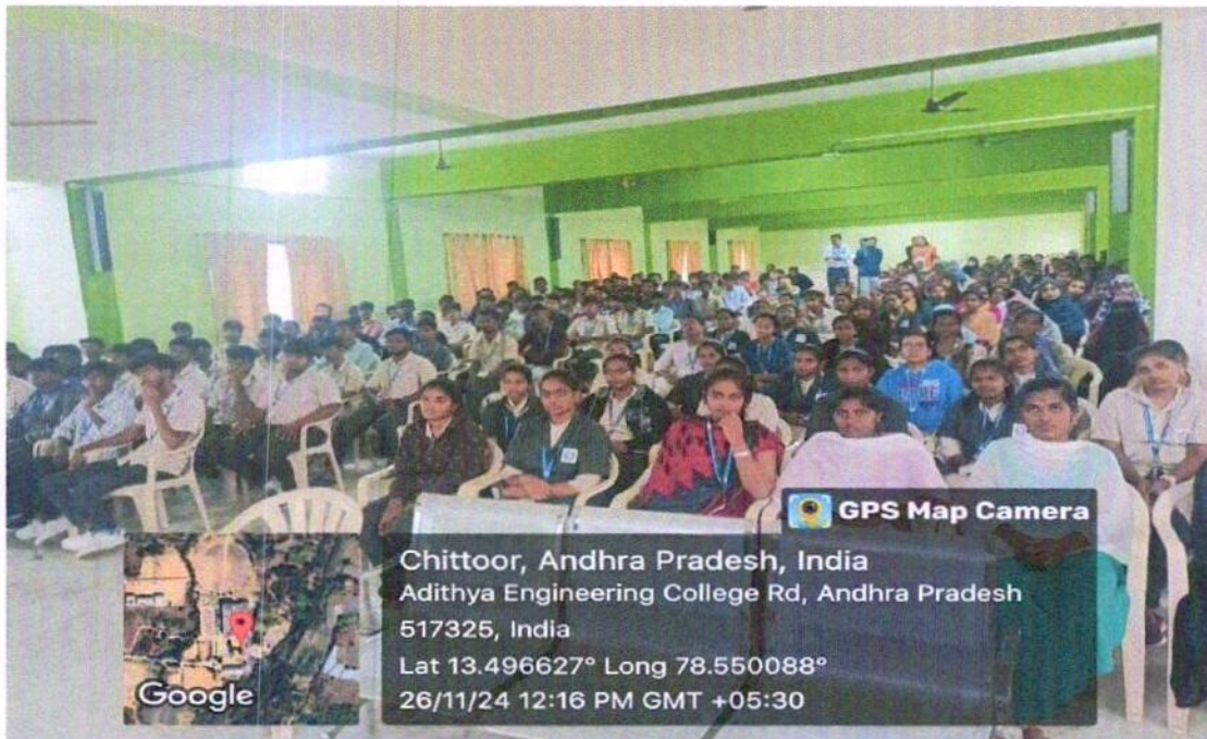
Figure2: Staff and Students attending the programme