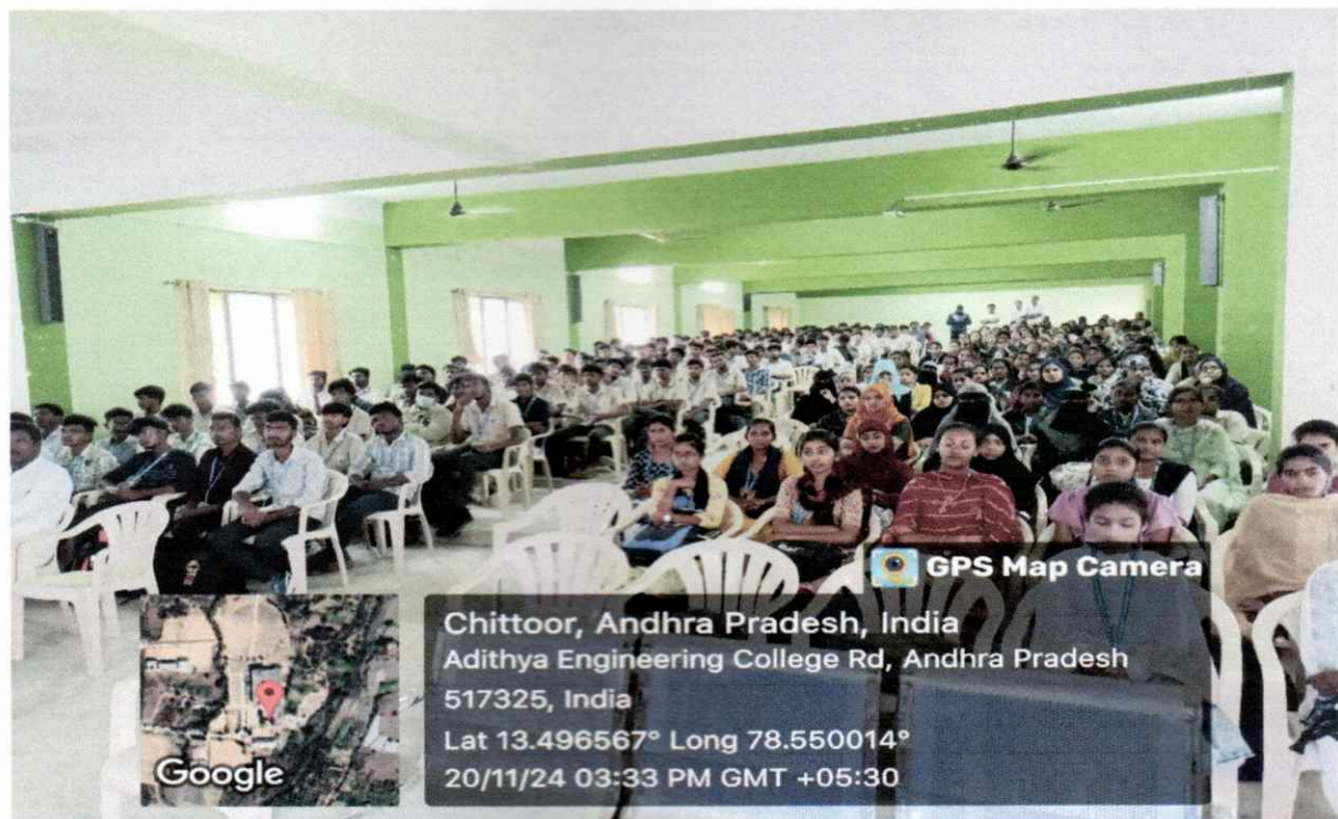
Figure4: Staff and Students attending the programme